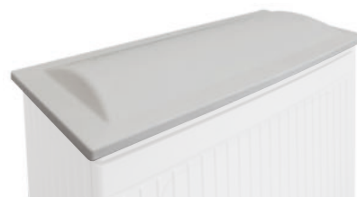
39169R střecha ke skříni MAGNA 39169