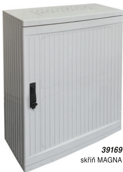
39169 skříň MAGNA