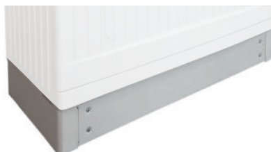
39169B podstavec ke skříni MAGNA 39169