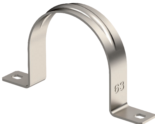
Oboustranná přichytka pro kabely a trubky