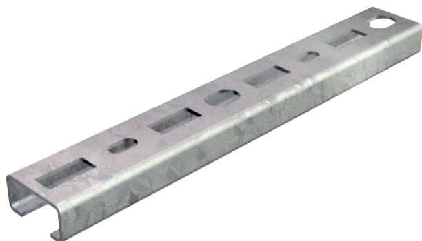
Profilová lišta děrovaná, šířka výřezu 16 mm.