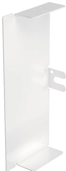
Koncový díl pro uzavření kanálů LKM.