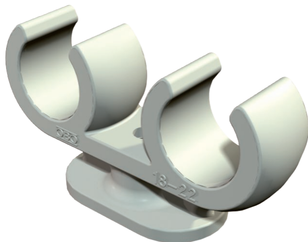
Patková příchytka pro 2 kabely 18-22 mm