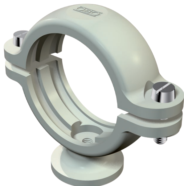
Patková příchytka ISO 20,5-22 mm