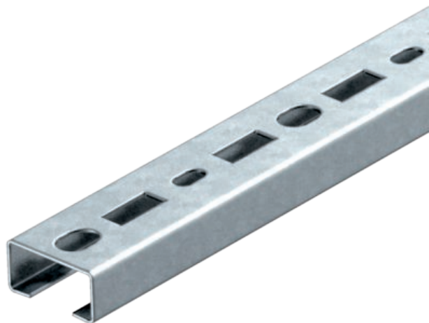
Profilová lišta děrovaná, šířka výřezu 17 mm 150x35x18