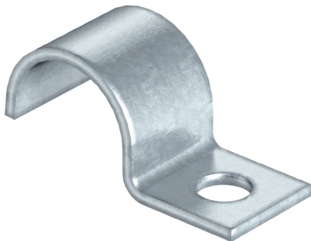
Jednostranná přichytka pro kabely a trubky 9mm