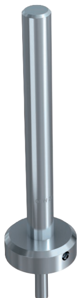
Montážní nástroj BZ-IGS pro průvlakovou montáž.