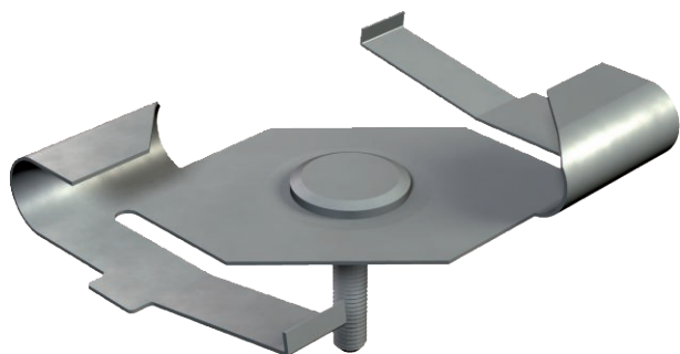
Svorka pro stropní profily se závitovým svorníkem