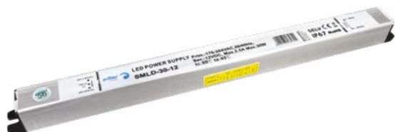
DRIVER 30W/M IP67