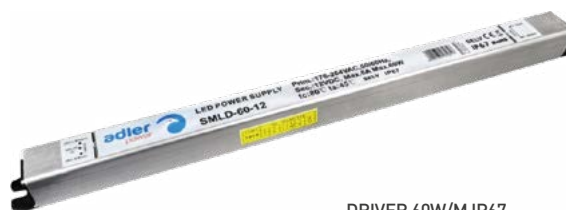
DRIVER 60W/M IP67