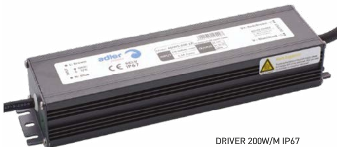
DRIVER 200W/M IP67