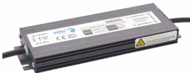
DRIVER 100W/M IP67