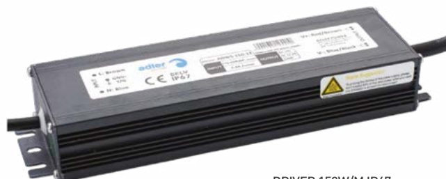
DRIVER 150W/M IP67