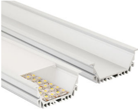
max. 16 mm