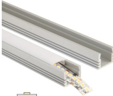
max. 11 mm