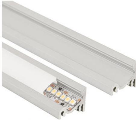
max. 10 mm