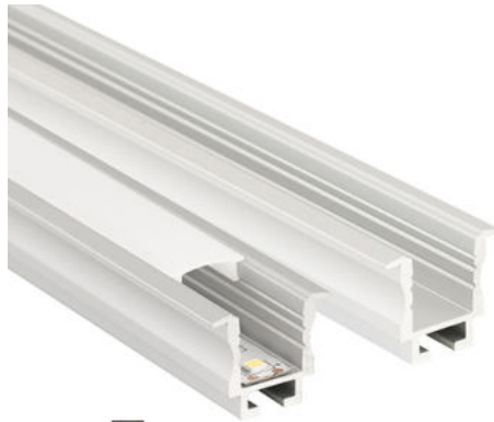
max. 12 mm