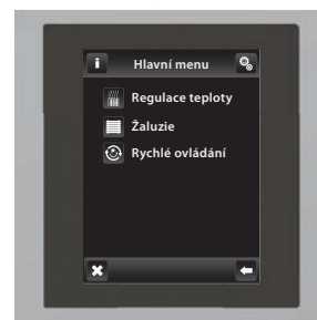
chrom / šedá