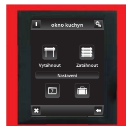
červená / hliníková