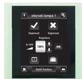
sklo / šedá