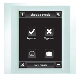
bílá / perletová