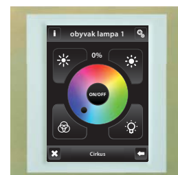
titan / ledová