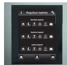
hliník / tm.šedá