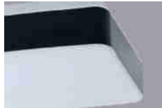
TILIA C dekorativní pás – černý mat