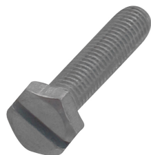
614 3 6XX