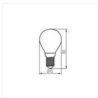
XLED G45E14 4,5W, XLED G45E14 6W