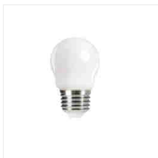
XLED G45E27 4,5W, XLED G45E27 6W