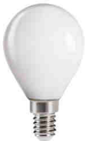
XLED G45E14 4,5W, XLED G45E14 6W