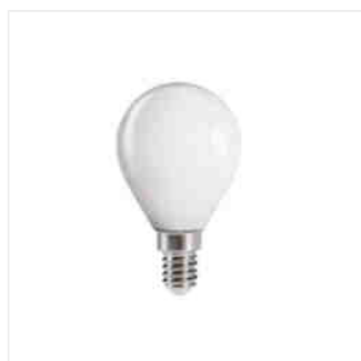
XLED G45E14 4,5W, XLED G45E14 6W