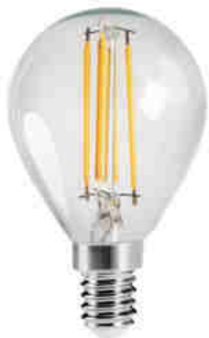
XLED G45 E14 4,5W