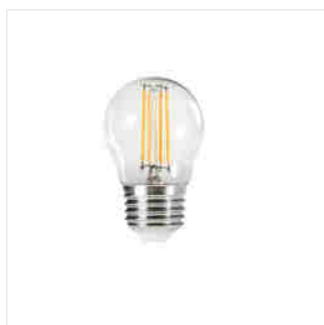
XLED G45 E27 4,5W