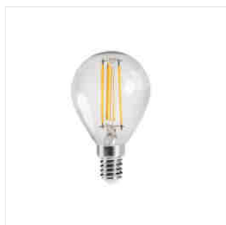
XLED G45 E14 4,5W