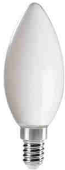
XLED C35E14 4,5W-WW-M