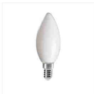
XLED C35E14 4,5W, XLED C35E14 6W