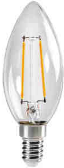
XLED C35E14 2,5W