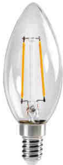
XLED C35E14 2,5W