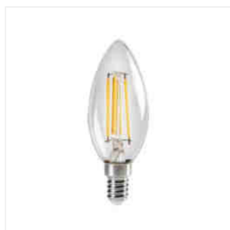
XLED C35E14 4,5W