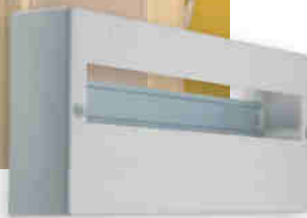
● DB118W 1X18P/SM