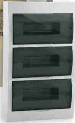
● DB312S 3X12P/SMD