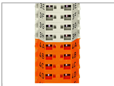
Marking by direct printing (upon request).