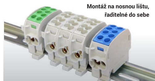
Montáž na nosnou lištu, řaditelné do sebe