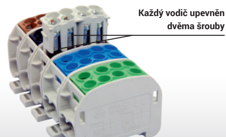
Každý vodič upevněn dvěma šrouby