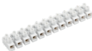
H-4MM2 PP M