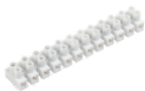
H-2,5MM2 PP M