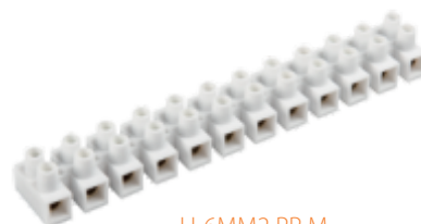
H-6MM2 PP M