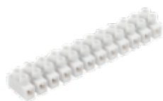
H-10MM2 PP M