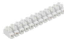
H-16MM2 PP M