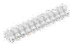
H-10MM2 PP M