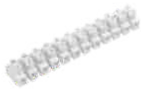
H-2,5MM2 PP M