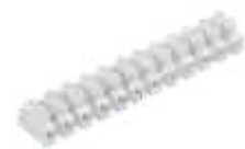
H-16MM2 PP M