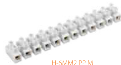
H-6MM2 PP M