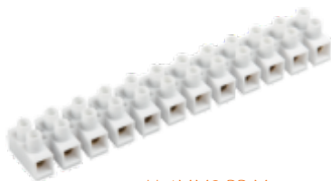
H-4MM2 PP M