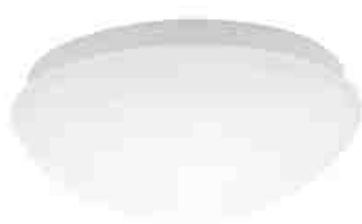
PIRES ECO DL-250 NS