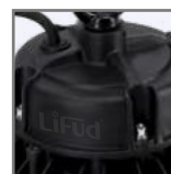
zewnętrzny zasilacz LIFUD*