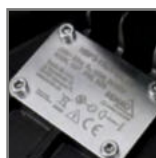
grawerowana tabliczka znamionowa