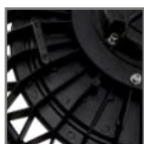
radiator odprowadzający ciepło