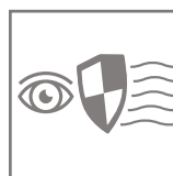
brak efektu migotania