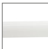
szkło w kolorze mlecznym