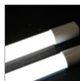
diody LED o zwiększonej wydajności