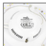
zasilacz zapewniający bezawaryjną pracę