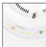
wbudowane źródła światła LED