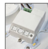
wbudowany czujnik ruchu w wersjach MS