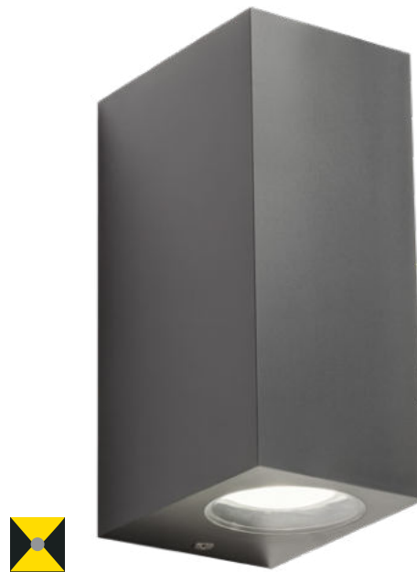
WALL LAMP • APLICĂ