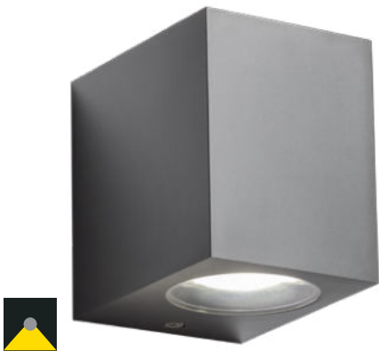
WALL LAMP • APLICĂ

Konštrukcia ABS v tmavošedej farbe, priehľadné polykarbonátové difúzory.