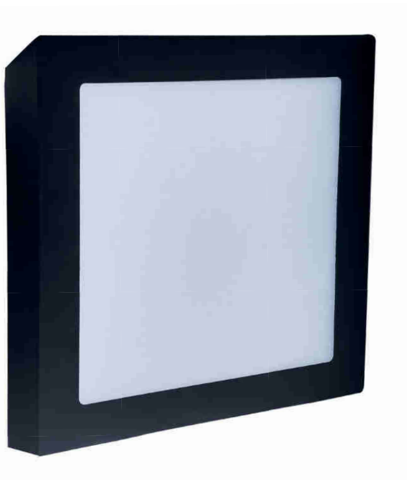
LED FENIX SQUARE