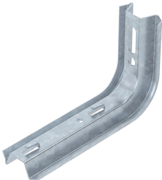
Výložník z profilu TP s upevňovacími jazýčky.