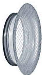
TADFG s ochrannou mřížkou