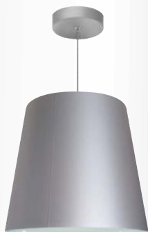
Z683 + ZSL-K

závěsné kruhové svítidlo - vertikální poloha zdroje - těleso ze segmentů PETG pokryto barevnou translucenční fólií - volitelné barevné provedení - spodní opálový kryt z PMMA - závěs se objednává samostatně