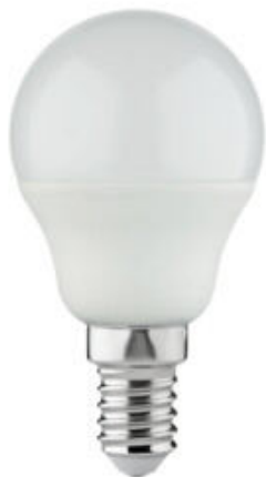
IQ-LED G45E14 3,4W