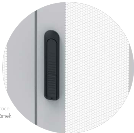
Detail perforace 3 bodový zámek