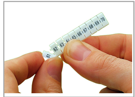
Separating an individual marker from the WMB marker strip – for larger terminal blocks.