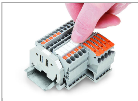
Snapping a marking strip into the marker slot.