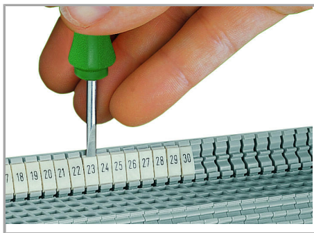
Snapping a WMB marker strip into the marker slot of the double marker carrier.