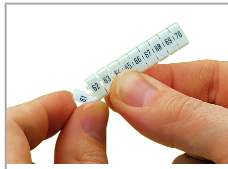
Separating an individual marker from the WMB marker strip – for larger terminal blocks.