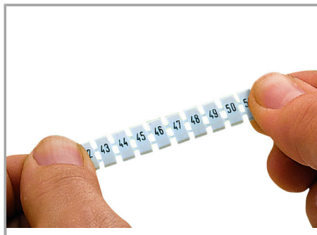
Stretching a WMB marker strip.