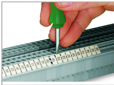
Snapping a marking strip into the marker slot.