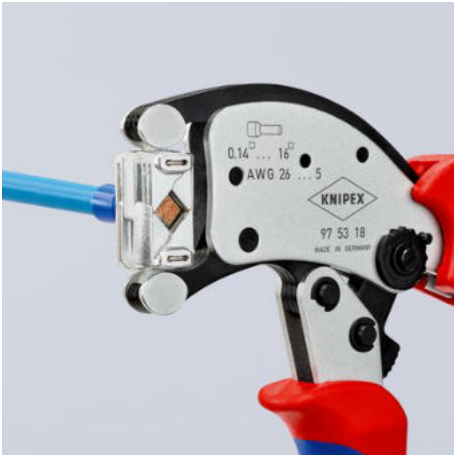
Jedinečná flexibilita: dutinky lze do otočné lisovací hlavy zavádět z téměř každé pozice