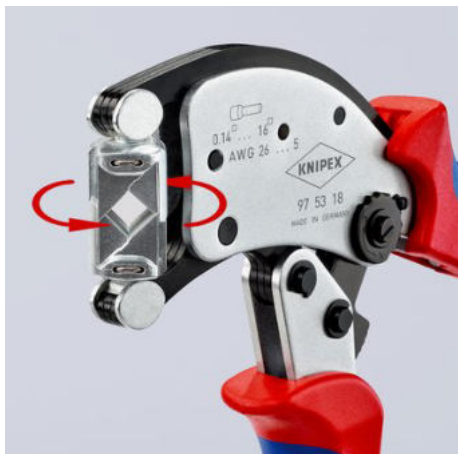
Lisovací hlava otočná o 360° pro nejlepší přístup i ve stísněných prostorech