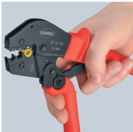
První krok: nadzdvížení ramena dvěma prsty, dokud obě čelisti neleží na lisované spojce