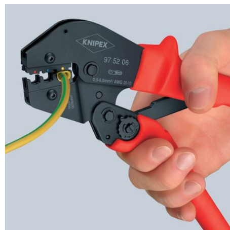
Druhý krok: nyní použít celou ruku pro další lisování