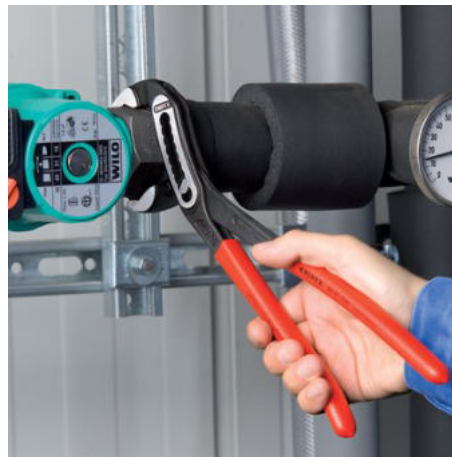
Samosvorné na trubkách a matkách: nehrozí sklouznutí po obrobku; veškerou sílu úchopu lze využít k natočení obrobku; pevný stisk ramen kleští není nutný, díky tomu stačí vynaložení menší síly