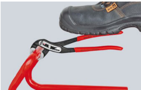
Samosvorné na trubkách a matkách: nehrozí sklouznutí po obrobku; veškerou sílu úchopu lze využít k natočení obrobku; pevný stisk ramen kleští není nutný, díky tomu stačí vynaložení menší síly