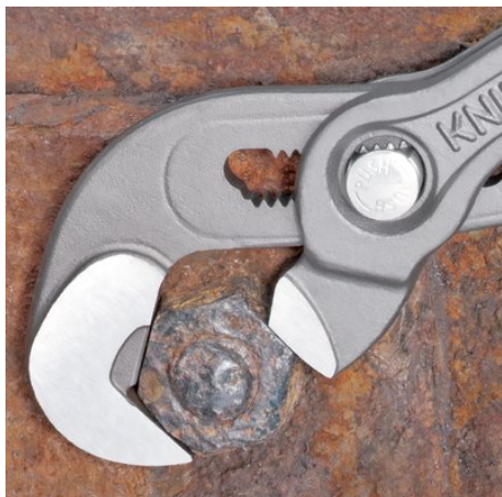
Práce se zrezivělou maticí se zaoblenými hranami