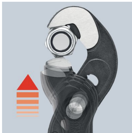
Jemné nastavení stisknutím tlačítka: rychle a komfortně