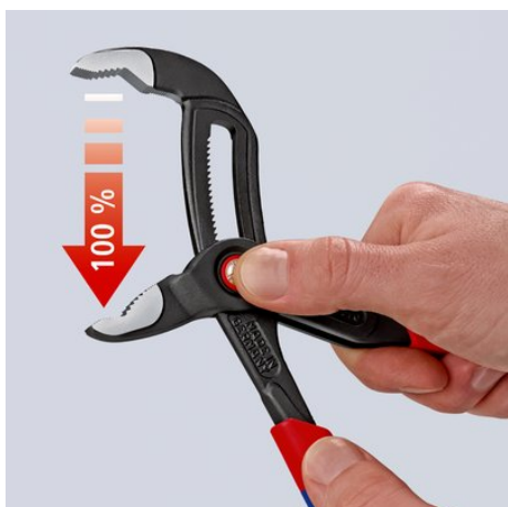
Stisknout knoflík – kompletně otevřít kleště