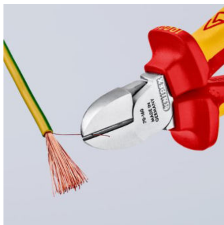
čistý řez tenkých měděných drátů, a to i na hrotech břitů